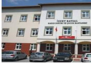
KADIN DOĞUM - ÇOCUK ÜNİTESİ