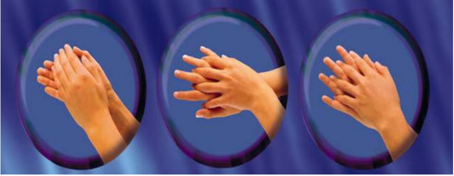
Resim:15 Susuz el antiseptisi uygulama şekli.(Avuç içi, parmak araları, el sırtı)