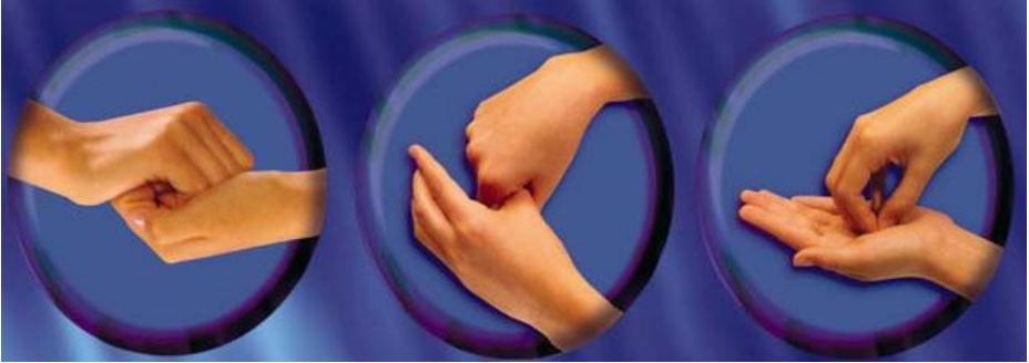
Resim:16 Susuz el antiseptisi uygulama şekli.(Çapraz parmaklar, başparmak ve avuç içinde parmaklar.)